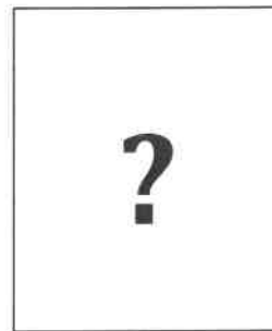
..... Service civique