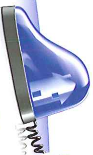
Opération tranquillité vacances

Faites attention aux informations (dates de vacances, destinations, photos, ...) que vous publiez sur les réseaux sociaux et soyez également vigilants avec celles publiées par vos enfants.